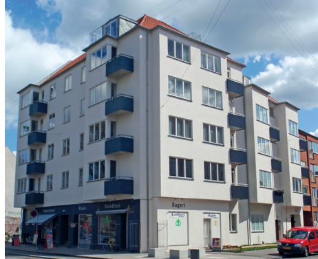
Efter opsætning af isolering

Når ejendommen har opnået den tæthed, er det vigtigt at få etableret tilstrækkelig luftskifte gennem hensigtsmæssigt placeret luftindtag i vinduesventiler i de forskellige opholdsrum.