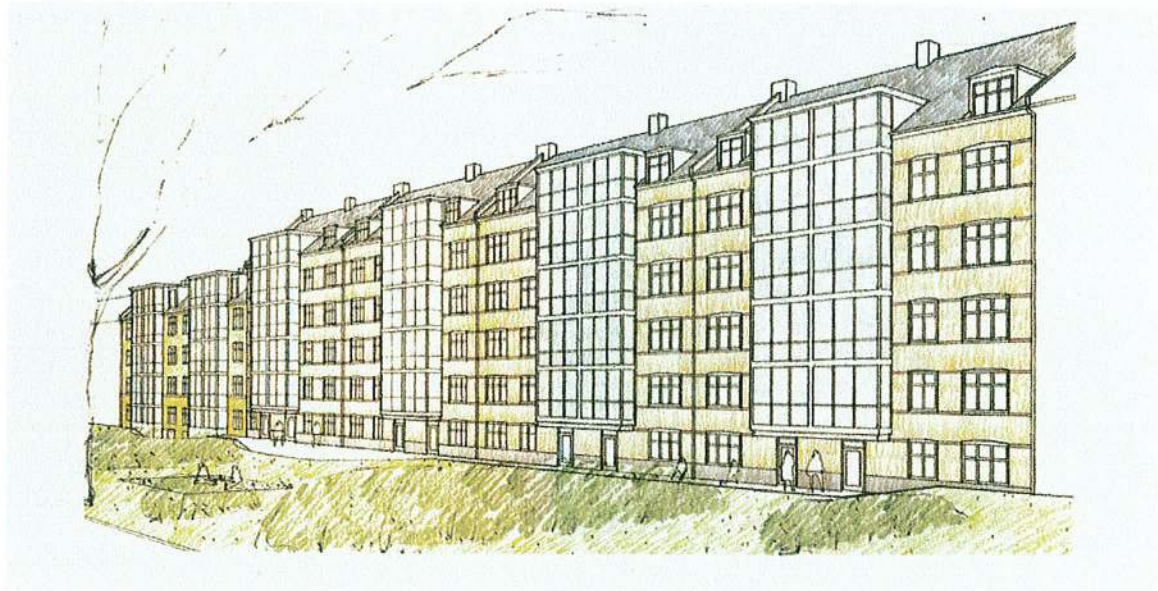
Perspektiv af gårdfacader Helgesvej 6-14 efter byfornyelsen.

Hovedentreprenør/partner : Skanska AS www.skanska.dk/karre24