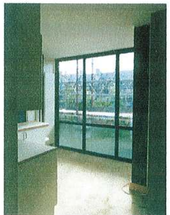
Fotos fra Karré 24 under byggeriet.