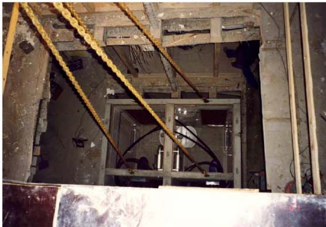
Badeværelset sænkes ned i ejendommen