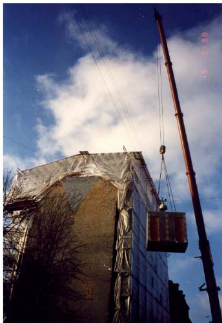
Badeværelset ankommer med kran

Gulve og vægge i tilstødende rum blev ligeledes istandsat i fornødent omfang.