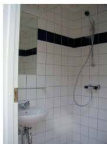
Badeværelse set indefra