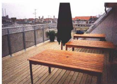
Den endelige løsning for tagterrassen