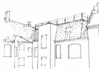
PERSPEKTIV AF FACADEUDSNIT

Foreningen ønskede derved at skabe et fælles opholdsareal, hvor dagens lyse timer kunne "forlænges" trods ejendommens beliggenhed midt i byen.